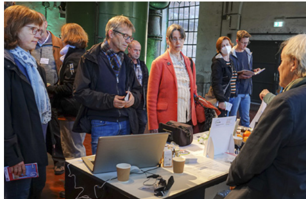
Stand der BEG-RW beim Energietag Ruhr 2022.